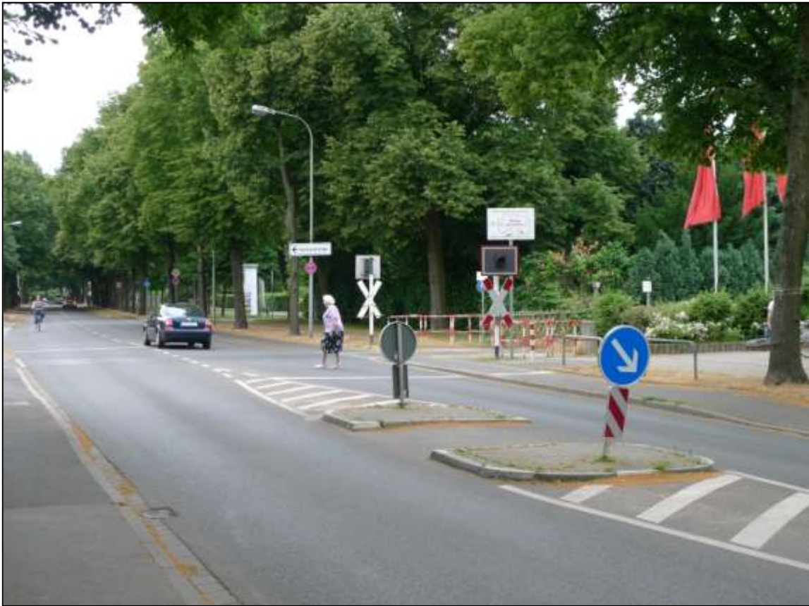
Querungshilfe an der Forstwaldstraße. Im Hintergrund der Bahnübergang/Schlufftrasse. Anders als am Nauenweg wird der Radweg hier nicht durch sog. „Umlaufsperrn“ blockiert. Letztere gelten hier nur für Fußgänger.

Eisenbahnkreuzungsgesetz, mit Verlaub, wenig überzeugend. Zumindest darf von einem Ermessensspielraum des zuständigen Verwaltungsbereiches ausgegangen werden. Was zwecks besserer Erreichbarkeit einer Sparkassenfiliale machbar gewesen ist, sollte im Falle eines möglichst verkehrssicheren Schulweges nicht durch allzu strenge Auslegung eines Gesetzes ausgeschlossen werden.